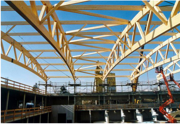
Palais des sports, 45 x 75 m

Tél. ++41 24 445 12 32 Fax ++41 24 445 52 28